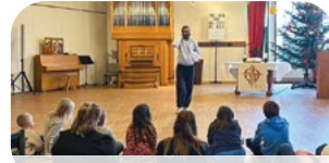
Kinder-Familie - S. 16