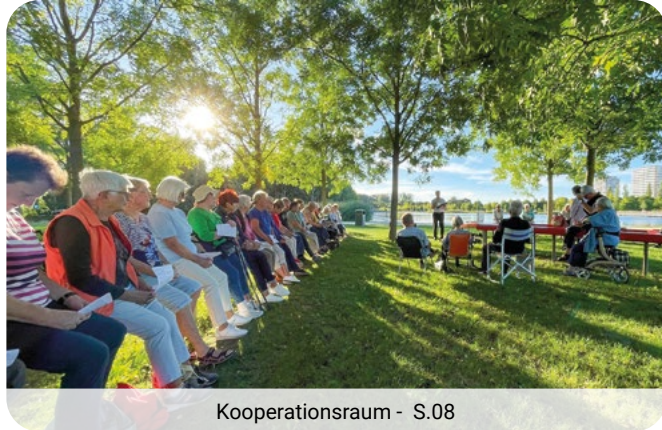
Kooperationsraum - S.08