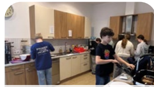
Auferstehungsgemeinde- S. 34