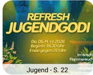
Jugend - S. 22