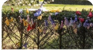
Kreuzgemeinde - S. 30