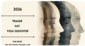
Erwachsene - S. 26