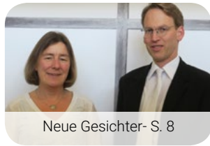
Neue Gesichter- S. 8