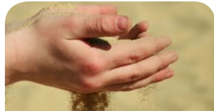
Kurz angedacht - Seite 6