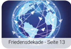
Friedensdekade - Seite 13