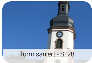
Turm saniert - S. 28