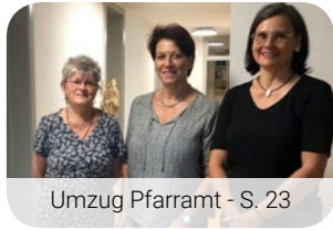
Umzug Pfarramt - S. 23